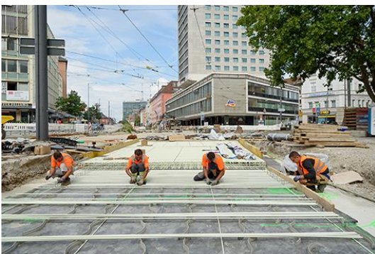
Arbeit an der „unteren Lage“ der Bewehrung.