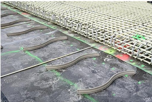
Verlegung der Abstandhalter für die Einhaltung der Betondeckung.