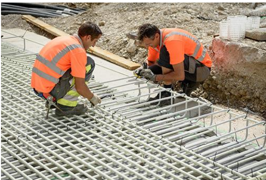
Verlegung der gebogenen Stäbe.