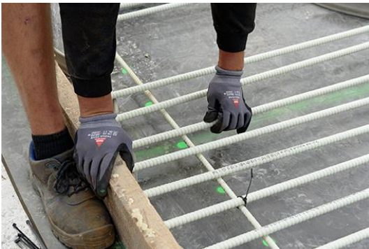
Ausrichtung der Längsstäbe gemäß des im Bewehrungsplan vorgeschriebenen Abstands.