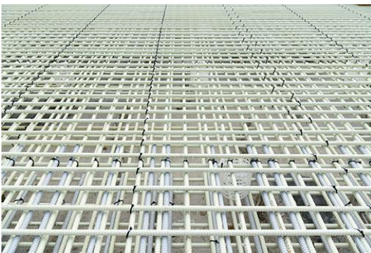
Ansicht einer mit Combar bewehrten Bodenplatte, Foto: Moritz Bernouilly