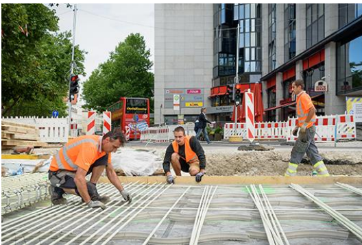
Ausrichtung der Längsstäbe gemäß des im Bewehrungsplan vorgeschriebenen Abstands.