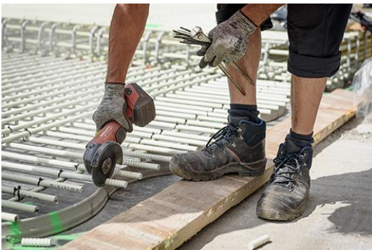
Die Combar Bewehrungsstäbe werden auf die richtige Länge abgelängt.