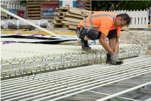
Befestigung der Bewehrung mit Kabelbindern.