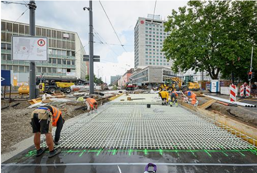
Die „untere Lage“ der Bewehrung unmittelbar vor der Fertigstellung.