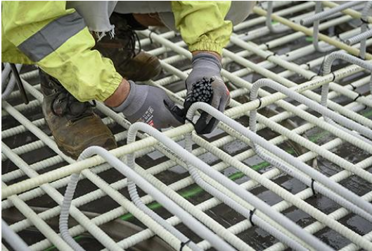
Befestigung mit den geraden Stäben.