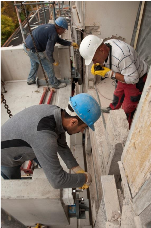
Aus Gründen des Brandschutzes wurden Stahlbetonbalkone montiert.