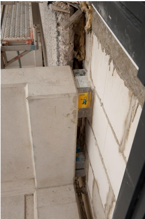
Im unteren Bereich des Balkons wurde die Querkraft mit dem Schöck Isokorb Typ KST-QST übertragen. In den oberen Teil der Brüstung betoniert das Fertigteilwerk den Isokorb KS.